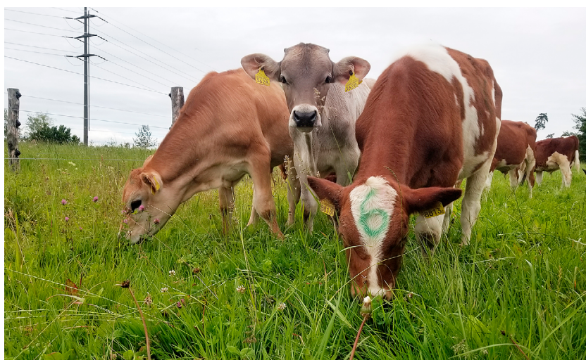
Trois génotypes en essai de pâturage.

https://doi.org/10.34776/afs16-206f Date de publication: 15 Décembre 2025